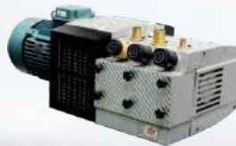
D-LV 2600 DVVL

Suitable for Heidelberg CD102 Feeder & Delivery