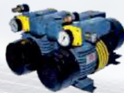
D-LV 1000 C DV

Suitable for Offset Delivery Application