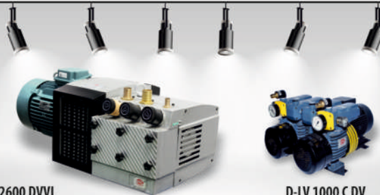
D-LV 2600 DVVL

Suitable for Heidelberg CD102 Feeder & Delivery