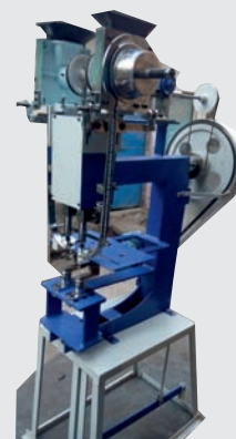
Eyelet Punching Machine