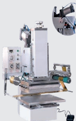
Hot Foil Stamping Machine