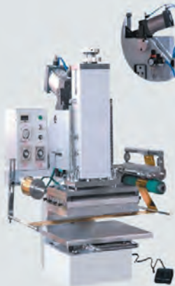
Hot Foil Stamping Machine