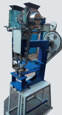
Eyelet Punching Machine