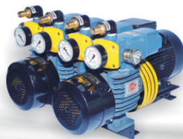
D LV 1000 C DVVL For Heidelberg Double Color