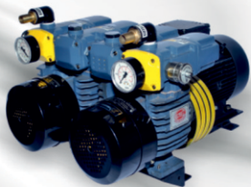
D LV 1000 C DV For Komori Offset