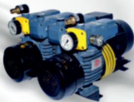
D LV 1000 C DV For Komori Offset