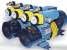
D LV 1000 C DVVL For Heidelberg Double Color