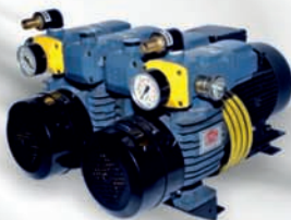
D LV 1000 C DV For Komori Offset