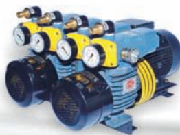
D LV 1000 C DVVL For Heidelberg Double Color