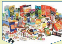
Rigid & Flexible Packaging