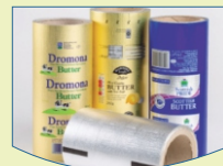
Paper, Film, Foil, Inks & Other Consumables