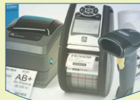
Barcodes & RFID