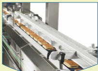
Food Production & Processing Equipment