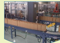
End-of-Line Packaging Solutions