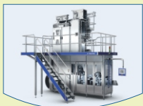
Packaging Machines, Materials & Equipment