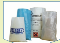
Woven, Sacks & other Bulk Packaging Solutions