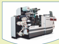
Label Printing Equipment