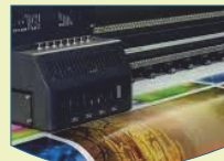
Digital Printing and Wide Format Printer