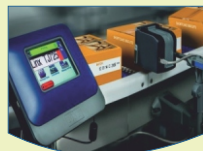
Coding & Marking Solutions