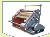
Corrugated Box Making Machinery