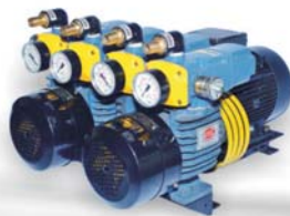
D LV 1000 C DVVL For Heidelberg Double Color