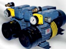
D LV 1000 C DV For Komori Offset