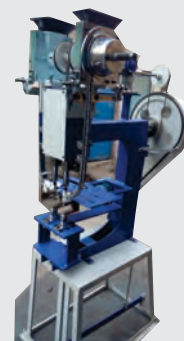
Eyelet Punching Machine