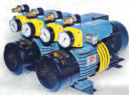
D LV 1000 C DVVL For Heidelberg Double Color