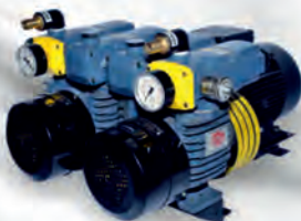
D LV 1000 C DV For Komori Offset