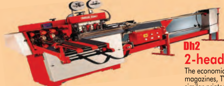
Dh2 2-head saddle wire stitcher

Upto 20" (500mm) Spine. Bind notebooks in 2-ups mode upto 16,000 per hour with automatic feeding and 4th knife operation. Saddle Stitcher is meant for gathering forms, center stitching and 3-knife trimming magazines, notebooks, booklets, leaflets, financial reports and a wide range of similar products. Modular design allows expansion upto ten auto feeders. Flowline can accommodate maximum product size of 300 X 305 mm. Speed 8,000 cph.