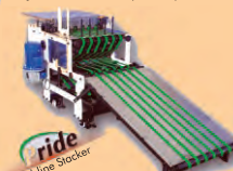
ride Webline Stacker

Side binding solutions. Form collation, inline stitching, missed section rejection. Collect up to 24 printed forms and produce magazines, textbooks copies at upto 5000 copies per hour.