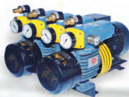
D LV 1000 C DVVL For Heidelberg Double Color