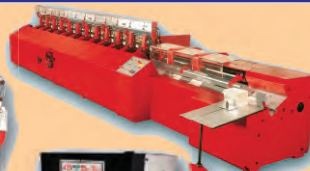
Paper Drilling Machine

The economical production of center-stitched brochures, magazines, TV guides, timetables, catalogues, lists and similar printed products.