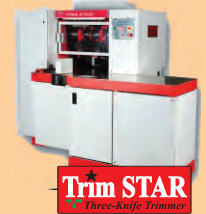
Trim STAR Three-Knife Trimmer

The PRIDE stacker can be adjusted to any speed of web offset machine of multi webs. It reduces man-power and produces neat stacks minus air-trappings.