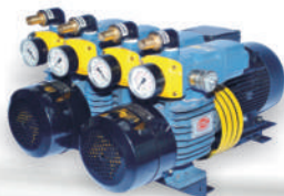
D LV 1000 C DVVL For Heidelberg Double Color