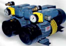
D LV 1000 C DV For Komori Offset